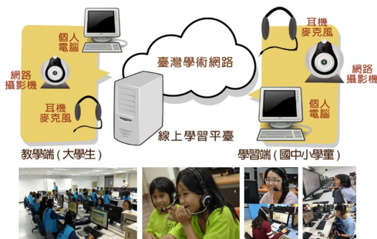
【圖 1 數位學伴計畫線上環境與設備架構】

一、以大學學伴制為概念，招募、培植大學生擔任偏遠地區國民中小學/數位機會中心(以下簡稱 DOC)學童之學伴，藉由視訊設備與線上學習平臺，讓教學端(大學生)與學習端(國民中小學/DOC 學童)以定時、定點、集體(集中於學校/DOC 電腦教室)方式，每週 2 次(每次 2 堂課，每堂課 45 分鐘)，進行一對一線上即時陪伴與學習，提供資訊應用及學習諮詢。